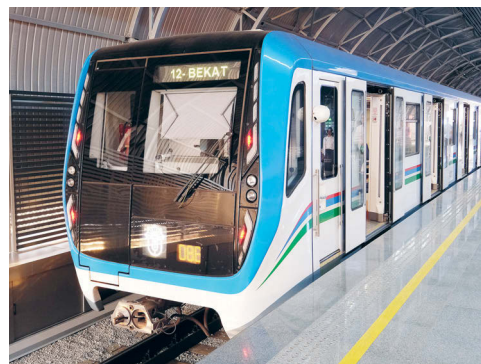
ПРЕСС-СЛУЖБА ГК 1520

Комплекс внедряемых систем охватывает новейшие разработки Дивизиона, подтвер-